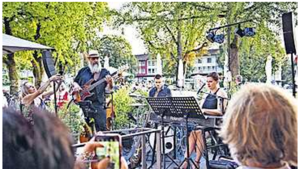
Die genauen Uhrzeiten sowie alle weiteren Termine finden Sie bei den teilnehmenden Gastronomiebetrieben oder auf www.hohenems.travel.