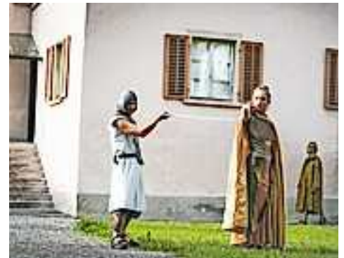
Eine Produktion von walktanztheater.com im Auftrag des Stadtmarketings Hohenems.