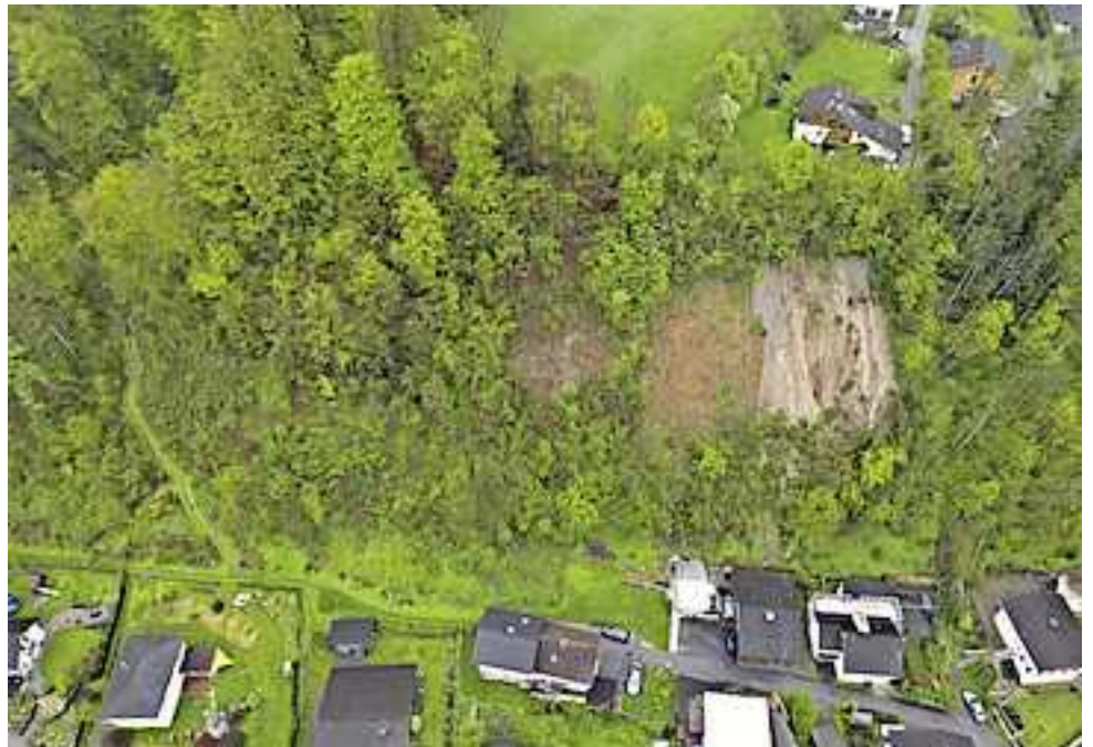
Eine Fotodokumentation der Wildbach- und Lawinerverbauung finden Sie auf www.hohenems.at

Unmittelbar bergseitig der Wohngebäude 22 und 24 wird ein Erschließungsweg, welcher zusätzlich als Fallboden für herunterfallendes Material dient, gebaut. Dieser Erschließungsweg wird mittels „Farfallasystem“ gesichert; eine aneinandergereihte, gekreuzte Metallkonstruktion mit einem darüber gespannten Metallnetz wird hangseitig verankert. Weitere Maßnahmen sind die Anbringung eines Hangmurnetzes entlang des Weges, Drainagen und flächendeckende Spritzbegrünung. Die Projektumsetzung erfolgt voraussichtlich ab Spätherbst 2024.