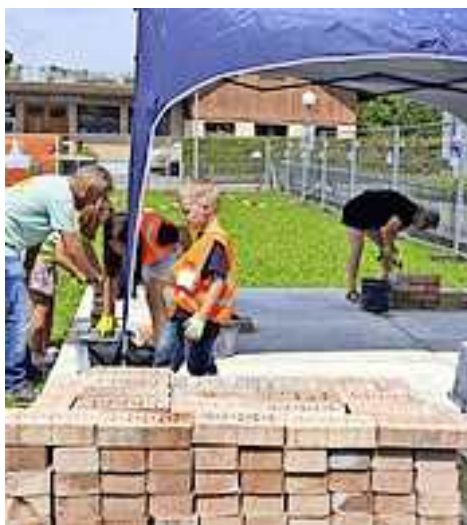
Weitere Fotos auf www.facebook.com/stadthohenems

Ein großer Dank gilt den Unterstützern: BAUAkademie Vorarlberg, Hornbach, Bentele Transporte, DIE KØJE