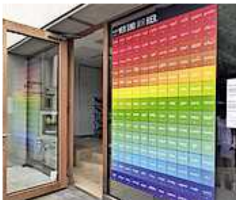
Die Kunstaktion am Hohenemser Schlossplatz 4 (Foto: tOmi Scheiderbauer).

Im Schaufenster des Schlossplatz 4 ist nun eine farbenfrohe Darstellung der gesellschaftlichen Vielfalt Vorarlbergs zu bestaunen: Eine visuelle Übersetzung der aktuellen Vorarlberger Einwohnerstatistik vom Februar 2024 – ein „Leuchtbild“ hinter Scheiben in öffentlichen Räumen, das den gemeinsamen Lebensraum von 130 Nationen, die in Vorarlberg vertreten sind, beleuchtet. „WER SIND WIR HIER“ ist ein „Bürger*innenspiegel“, eine politisch-poetische Darstellung der demografischen und physikalischen Tatsachen. Das Projekt soll eine Wahrnehmung und Auseinandersetzung dessen fördern, was allen uns trennenden Tendenzen entgegenwirkt.