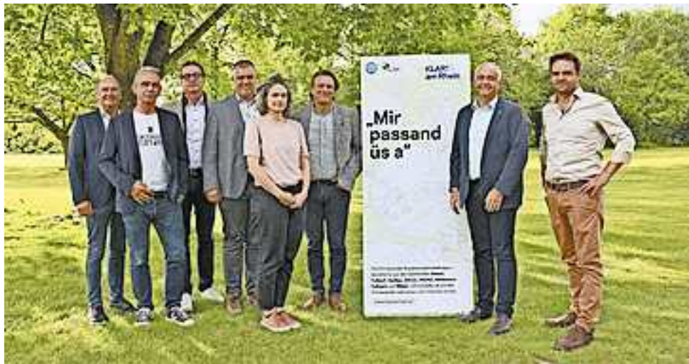
Die Vertreter der Gemeinden bei der Auftaktveranstaltung im Erholungszentrum Rheinauen.

Die acht Vorarlberger Rheintalgemeinden Altach, Fußach, Gaißau, Götzis, Höchst, Hohenems, Koblach und Mäder haben sich als „KLAR! am Rhein“ zusammengeschlossen. Der Klima- und Energiefonds unterstützt die Region mit dem Förderprogramm „Klimawandel-Anpassungsmodell-Region“ (KLAR!) dabei, sich frühzeitig auf die Herausforderungen des Klimawandels einzustellen – mit dem Ziel Schäden zu vermindern und die sich ergebenden Chancen zu nutzen.