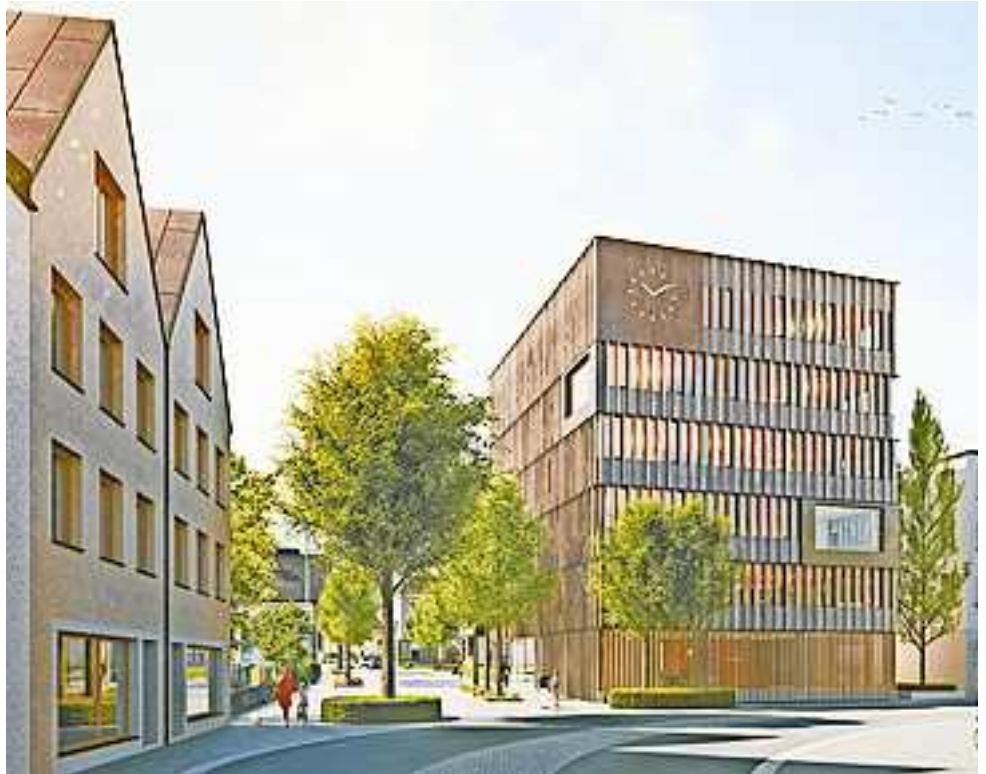
Das neue Rathaus wird im Frühjahr 2025 in Betrieb genommen.

„Das ‚noch positive‘ Ergebnis darf aber nicht über die schwierige Finanzlage der Vorarlberger Gemeinden hinwegtäuschen. Die Aufgaben der Gemeinden steigen und die laufenden Kosten für