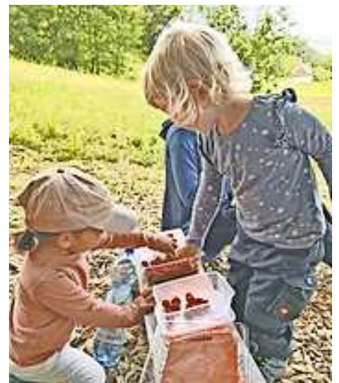
Worauf wartest du noch? Starte deine Babysitter-Reise mit Ringareia!