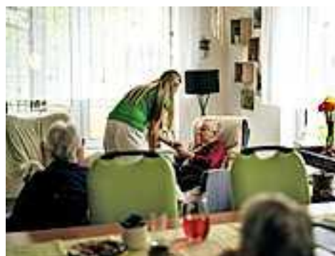
Weitere Veranstaltungen im Rahmen von „Pflege im Gespräch“ unter www.connexia.at

Auskünfte: Caremanagement der Stadt Hohenems, Tel. 05576/7101-1225 oder Mobiler Hilfsdienst, Tel. 0664/9161710.