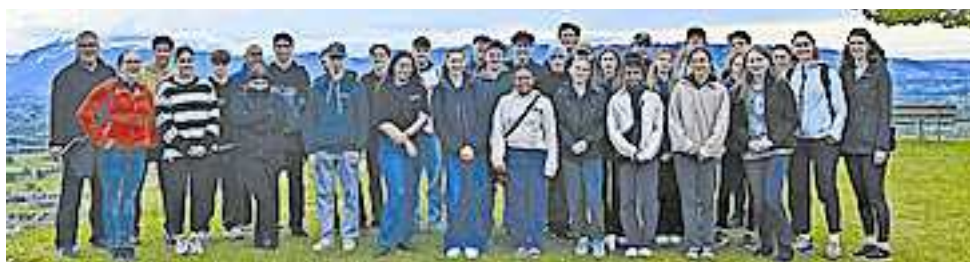
Die Firmlinge aus Hohenems in Bildstein.

ganz persönlich für seine Firmung ausgesucht hat und sich als Lebensmotto sozusagen auf die eigenen Fahnen schreibt. Die Sprüche reichen von „Für Gott ist alles möglich!“ bis zu „Liebe und tu was du willst!“