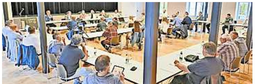
Die Stadtvertreter tagten erneut im Löwensaal.

Einstimmig wurde beschlossen, die die Stelle Caremanagement in der Stadtverwaltung bekleidende Person als Vertreter der Stadt Hohenems in die Mitgliederversammlung des Vereins „Mitanand – Mobiler Hilfsdienst Hohenems“ (ZVR-Zahl 114434659) zu entsenden.