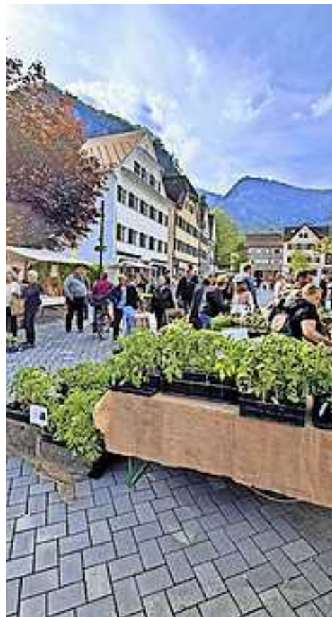
Weitere Fotos auf www.facebook.com/stadthohenems

Von Slow Fashion über Bio-Lebensmittel und fairen Handel bis hin zur behutsamen Revitalisierung der Innenstadt – in Hohenems wird Nachhaltigkeit in all ihren Dimensionen von vielen Unternehmen und Menschen gelebt. Ganz selbstverständlich und tagtäglich. Ein bewusster Umgang mit Natur und Mitmensch, ein Herz für Regionalität und die Verbundenheit mit dem Ort sind in Hohenems allgegenwärtig und stets spürbar. Mit der neuen Veranstaltungsreihe „Meine bewusste Entscheidung“ soll diese Orts- und Naturverbundenheit und die gelebte Nachhaltigkeit in Hohenems noch stärker im Stadtraum sichtbar und in den Köpfen bekannt gemacht werden. Den Auftakt machte der Jungpflanzenmarkt am vergangenen Samstag im Jüdischen Viertel.