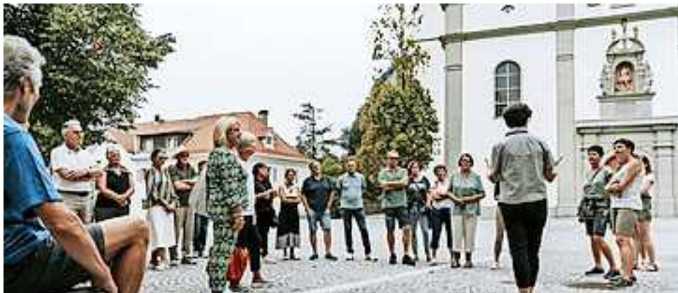
Weitere Infos unter www.hohenems.travel

• Treffpunkt: Stadtmarketing Hohenems, Marktstraße 2 • Dauer: ca. 90 Minuten • Preis: Erwachsene 10 Euro | Jugendliche (13 – 18 Jahre) 4 Euro | Kinder (12 Jahre und jünger) kostenlos