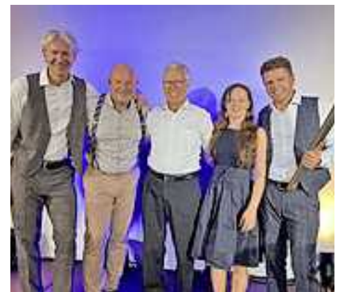
Die Vizeweltmeister auf der Mundharmonika zu Gast in Hohenems.

Das Publikum honorierte die großartige Leistung mit stehenden Ovationen und lautstarkem Applaus. Die Musiker bedankten sich mit Zugaben, die das Publikum mit großem Jubel honorierte.