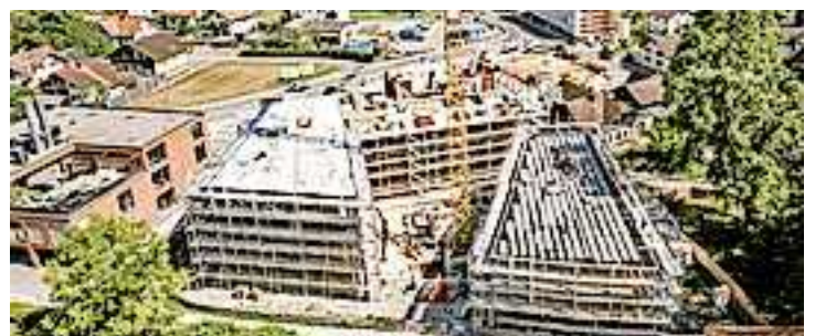
Wohnhäuser im Grünen und doch im Herzen der Stadt.