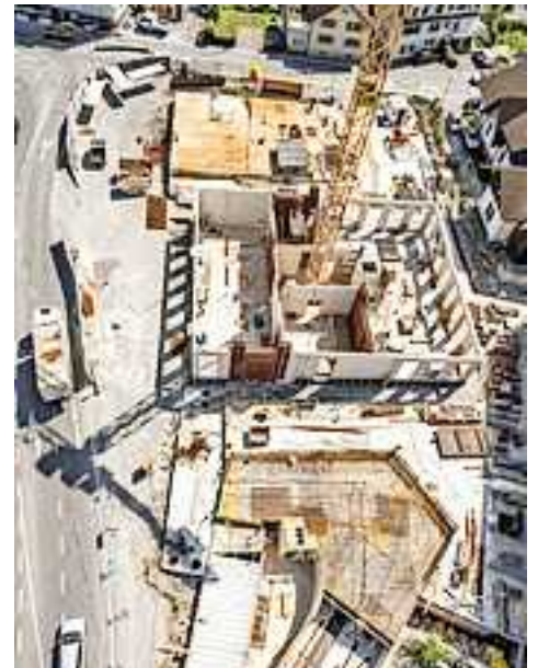
Wohn- und Geschäftshäuser mit Raum für flexibel einteilbare Gewerbeflächen.