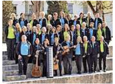
Weitere Infos unter Tel. 0650/2269666 und unter www.chorjoy.com !