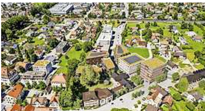
RathausQuartier mit öffentlichem Villengarten.