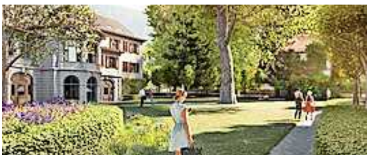
Heckenzimmer und Stadtwiese im öffentlichen Park.