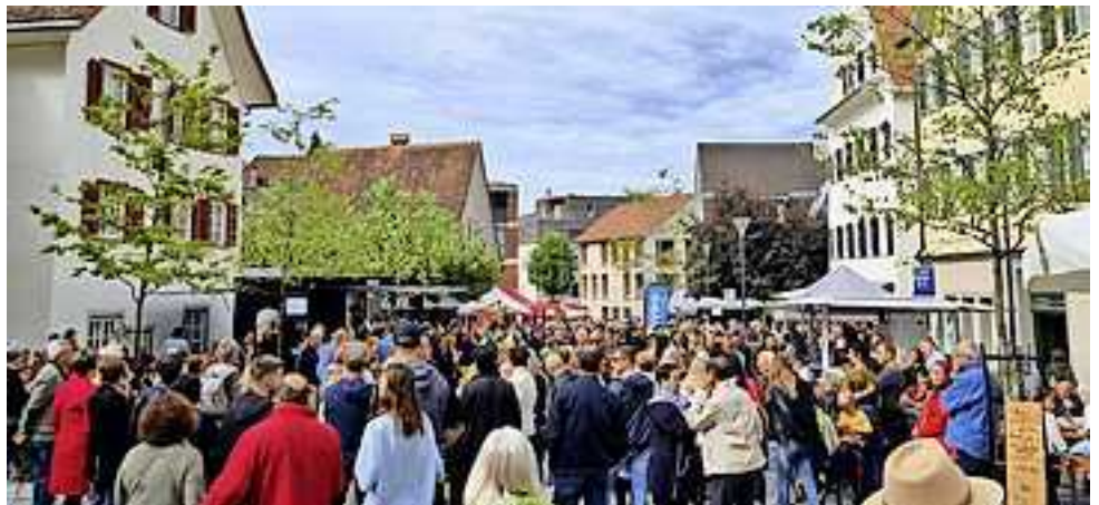
Weitere Fotos auf www.facebook.com/stadthohenems

Das Jubiläumsfest am Emser Markt zog zahlreiche Besucher an und zeigte eindrucksvoll, wie lebendig und vielfältig das Stadtleben in Hohenems ist. Ein herzliches Dankeschön geht an die Sponsoren, die dieses Fest ermöglichten: die Hypo Vorarlberg Bank AG und Rhomberg Bau GmbH.