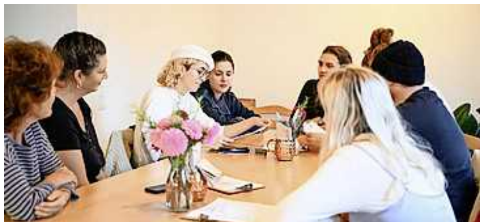
Die „Ticketliteratur“ des Poolbar Festivals im „Spuds“ in Hohenems.

Literarischen Genüssen konnten die Raumfahrer bei Kartoffelgeruch und gemütlicher Atmosphäre auf dem „Grumpra-Planeten“ Spuds in Hohenems lauschen. Ein großer Dank geht an die Poeten der Ticketliteratur, die zum Thema Dimension mit literarischen Kostbarkeiten die diesjährigen Poolbar Tickets live vertont haben und den Raumfahrtstopp der Ticketliteratur in Hohenems versüßten.