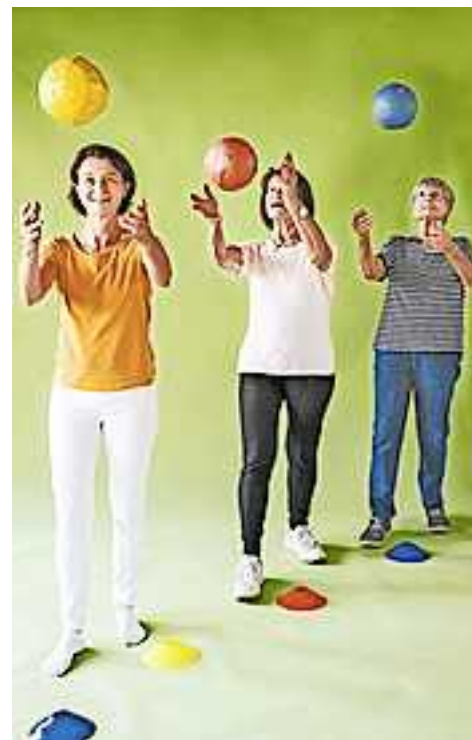
Eine Anmeldung ist bereits möglich – begrenzte Teilnehmerzahl.

Bitte beachten Sie die weiteren Veranstaltungen auf www.hohenems.at oder www.aktion-demenz.at