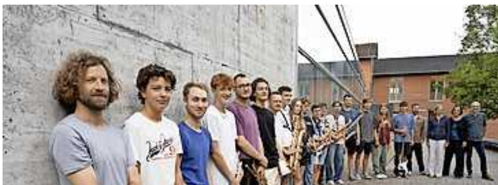
Die Proben sind in vollem Gange.

Gibt es denn auch andere Besetzungen außer des großen Ensembles?