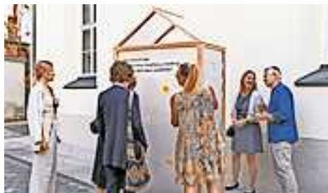
Das #tinyliteraturhaus sammelt Ideen und Wünsche von allen Besuchern.

Das Team ist neugierig auf die Menschen, für die es in den nächsten Jahren eröffnet wird. Welche Erwartungen