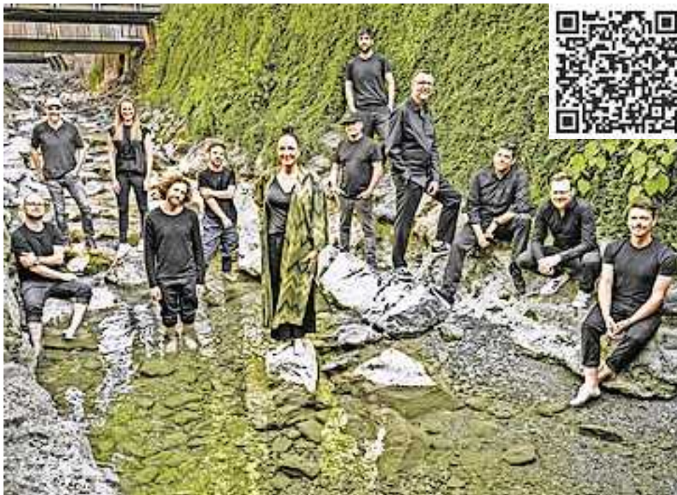
Das Jazzorchester Vorarlberg mit AJA.

Das Musikschulwerk Vorarlberg präsentiert in Zusammenarbeit mit dem JOV zum zweiten Mal junge Talente zwischen 16 und 26 Jahren, die im Jugendjazzorchester Vorarlberg in die Welt der