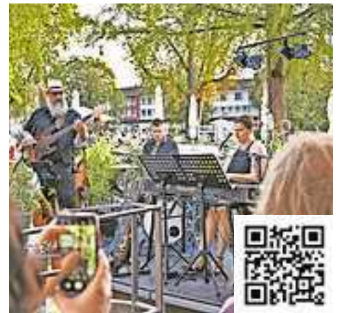
Alle Infos auf www.hohenems.travel