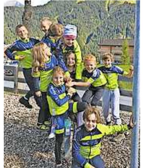
Stolz: Mountainbike-Erfolge für die U9 und U11!

Da Lumnezia auch Kristallregion ist, wurde jedes Kind mit einem Kristallpokal belohnt. Auf der Heimfahrt strahlten nicht nur die Kristalle wunderschön, sondern auch zehn glückliche und müde Kinder!