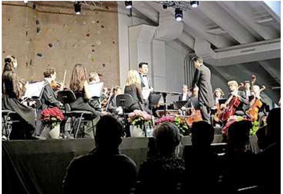
Klassikfreunde aus Hohenems waren zu Gast in Lech.