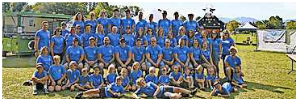
Die „Galgenbrüder laden kommenden Montag ein.“

be gibt es neben einem guten Wein auch feine Speckbrötchen. Auch kleine Dämmerstopp-Besucher kommen nicht zu kurz und können sich auf der Riesen-Hüpfburg vergnügen oder sich schminken lassen. Es ist für die ganze Familie etwas dabei, und so steht einem stimmungsvollen Dämmerstopp nichts mehr im Wege – und auch das Wetter kann dem Fest nichts mehr anhaben. Die Galgenbrüder trotzen jeder Witterung und freuen sich auf zahlreiche Besucher!