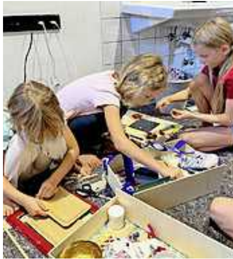
Weitere Fotos auf www.facebook.com/stadthohenems

bestaunten. Die geheimnisvolle Kiste wurde geöffnet, und es fühlte sich an, als ob der Glanz unzähliger Sterne in ihr versteckt gewesen wäre.