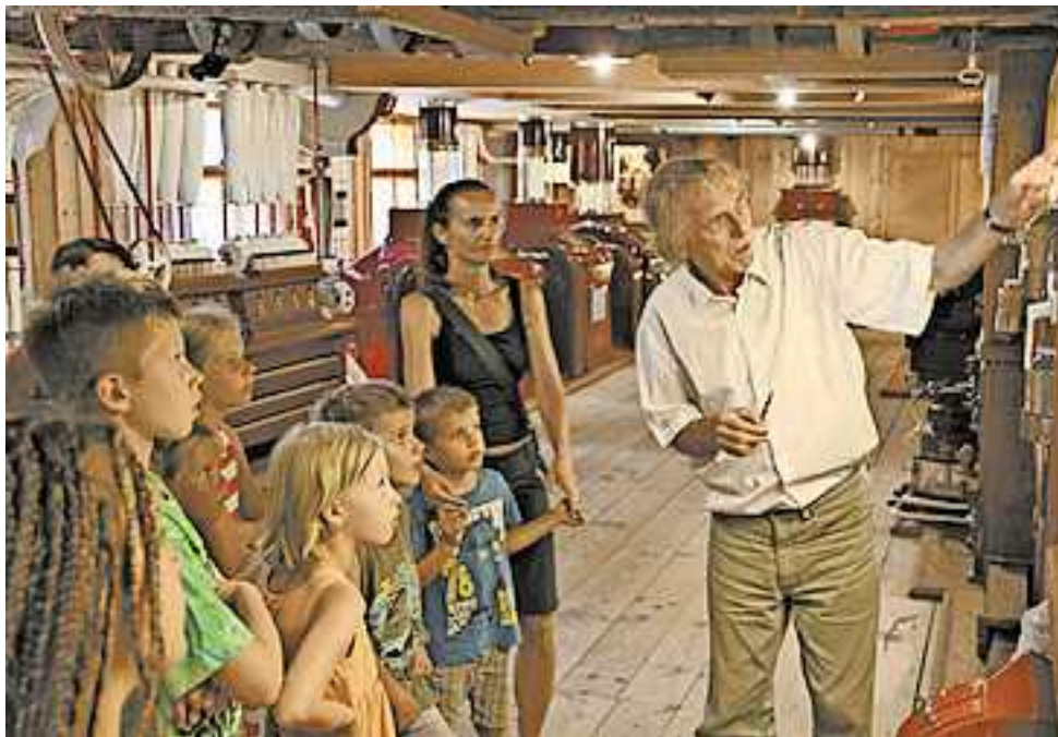
Weitere Infos unter www.reiseziel-museum.com

Die Anreise mit Bus und Bahn im gesamten „Reiseziel Museums“-Gebiet ist kostenlos. Ein unschlagbares Angebot, um bequem und umweltfreundlich zu den teilnehmenden Museen zu gelangen. Plant eure Reiseroute mit