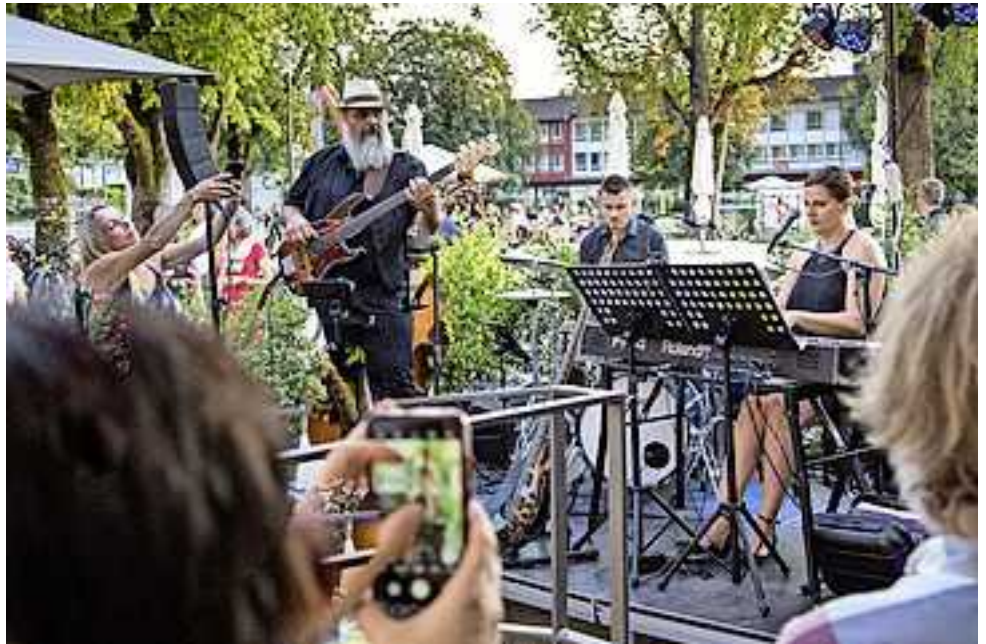
Alle Infos auf www.hohenems.travel