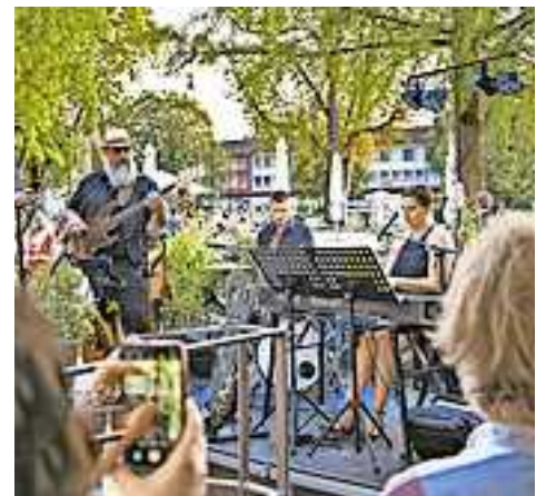
Alle Infos auf www.hohenems.travel