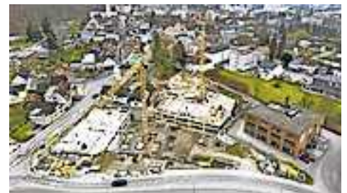
Die Arbeiten am Rathausquartier im März 2023 aus der Luft betrachtet: Der Rohbau der Tiefgarage ist mittlerweile fertig.