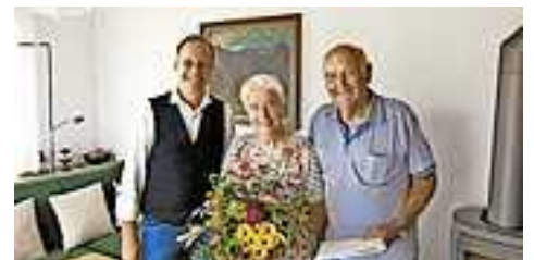
Das Stadtoberhaupt mit dem Jubelpaar Höscheler.

Auch Bürgermeister Dieter Egger stellte sich unter den Gästen ein, überbrachte die herzlichsten Glückwünsche und einen Blumenstrauß der Stadt sowie eine Ehrenurkunde des Landes.