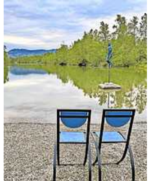
Im Areal des Kieswerks „Kopf-Kies“ am Alten Rhein (Rheinstraße 71, Altach) wird das Freilufttheater aufgeführt.

Der Kartenvorverkauf startete am 18. Juli 2023. Die Aufführung findet an fünf Terminen sowie zwei wetterbedingten Ersatzterminen statt. Karten können online und direkt beim Stadtmarketing Hohenems gekauft werden.