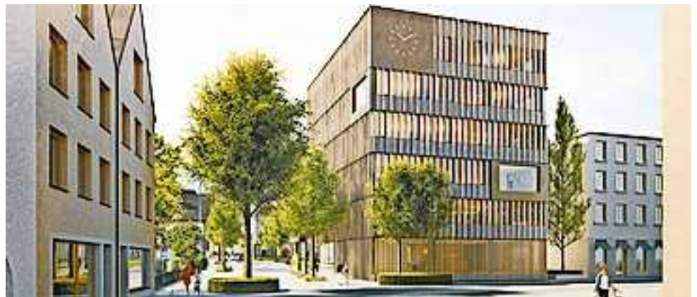
So wird sich das neue Hohenemser Rathaus 2025 präsentieren.