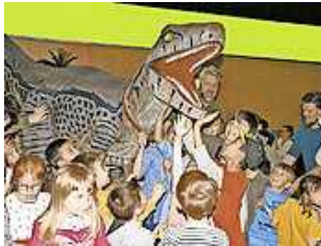
Weitere Infos unter Tel. 0660/9903639.

sind jeweils 30 Minuten vor Showbeginn an der Tageskasse vor Ort erhältlich.