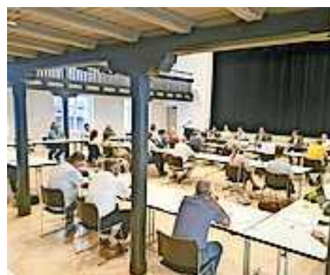
Die Stadtvertreter tagen erneut im Löwensaal.

Weitere Infos unter www.greatplacetowork.at!