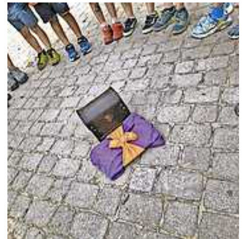
Gemeinsam ging es auf Schatzsuche.

Die Übernachtung im Kindergarten ist etwas ganz Besonderes für die Kinder, da sie es mitunter das erste Mal schaffen, ohne Eltern, ohne Schnuller oder einfach nur auswärts zu schlafen. Es kostet manche kurz etwas Überwindung, aber der Stolz am nächsten Morgen ist ganz besonders und großartig.