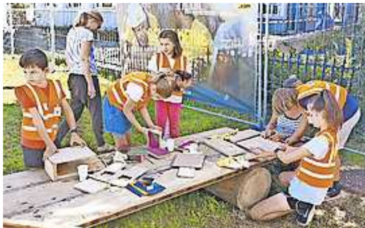
Vielseitige „Bauprojekte“ sind vergangenes Jahr entstanden.

2023 gibt es zusätzliche Möglichkeiten, sich auszuprobieren: Mit Ziegeln können Mauern gebaut werden und es wird auch einen Sand-/Matschbereich für die Kleineren geben.