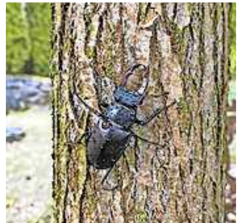
Hirschkäfersichtung im Oberklien.

Da es sich um eine geschützte Art nach der FFH-Richtlinie handelt, dürfen die Tiere sowohl lebendig als auch tot nicht aus der Natur entfernt werden. Sichtungen können Sie gerne der inatura Erlebnis Naturschau GmbH melden oder auch im Umweltreferat der Stadt Hohenems unter Tel. 05576/7101-1422 bzw. E-Mail umwelt@hohenems.at !