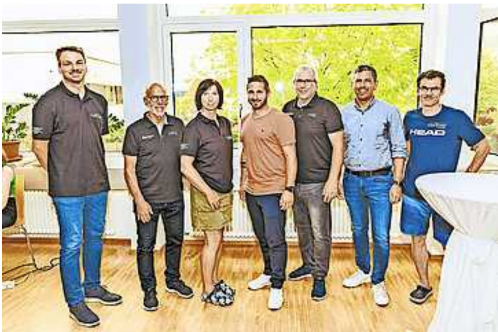
Weitere Fotos auf www.facebook.com/hohenems

Schüler aus der Unterstufe und Oberstufe aus allen Bundesländern kämpfen um den Meistertitel. Am Montagabend, dem 19. Juni 2023, fand die offizielle Eröffnung statt.