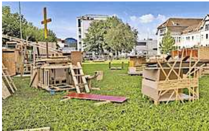
Wir freuen uns auf eine erfolgreiche Bausaison!

Auf einer Baustelle gibt es immer viel zu tun! Getreu dem Motto: „Wer will fleißige Handwerker sehen? Der muss zur Kinderbaustelle Hohenems gehen!“