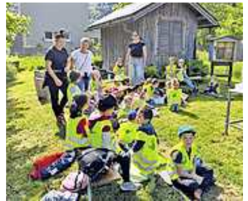
Die Kinder zeigten sich begeistert vom Bienenlehrpfad.