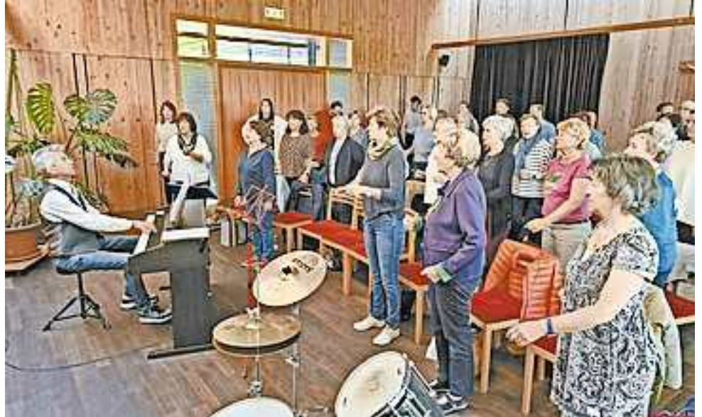
Der GV Nibelungenhort freut sich über zahlreiche Besucher, die mitfeiern möchten!