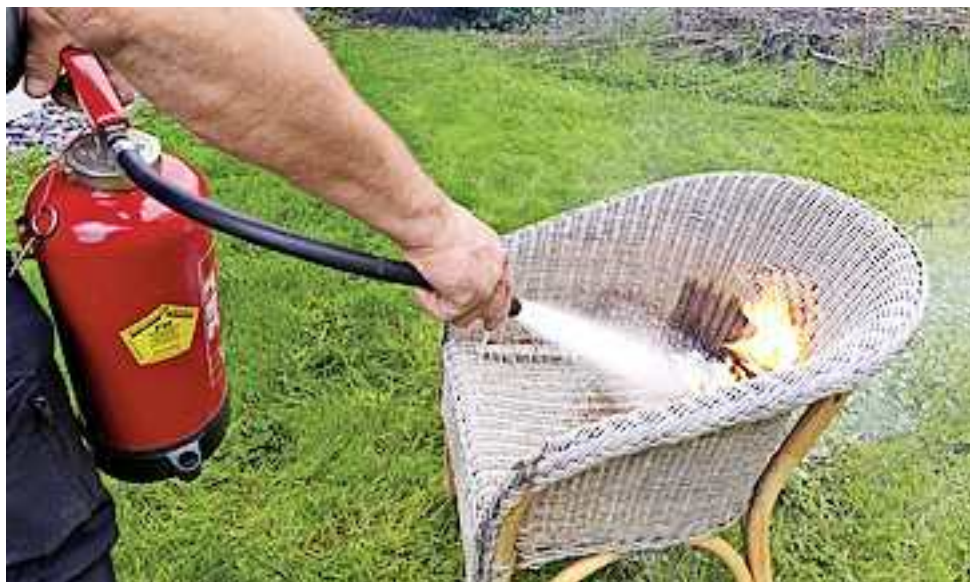
Weitere Infos unter www.frt-brandschutz.at

Bei der Feuerlöscherüberprüfung am Samstag, dem 25. Mai 2024, im Wirtschaftspark „Die Spinnerei“ in Hohenems können Sie Ihre Feuerlöscher überprüfen und warten lassen. In der Zeit von 8 bis 12 Uhr steht Ihnen das Team von „FRT Brandschutz“ zur Verfügung und beantwortet gerne auch Fragen zur Früherkennung von Bränden.