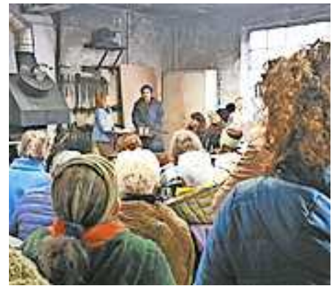
Volles Haus in der „Alten Schmiede“.