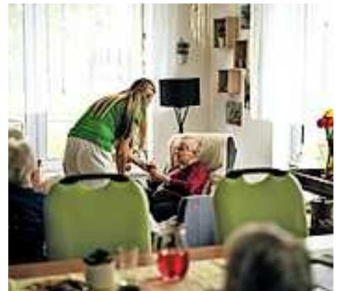
Weiteren Veranstaltungen im Rahmen von „Pflege im Gespräch“ unter www.connexia.at