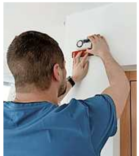
Montage eines Kohlenmonoxid-Melders

Weitere Infos unter www.sicheresvorarlberg.at