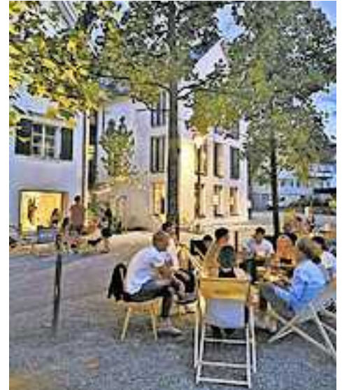
emsiana heißt auch Kultur im öffentlichen Raum.

Die teilnehmenden Museen sind im Zeitraum der emsiana kostenfrei oder ermäßigt zu besuchen. Die einzigartigen, kleinen Läden in und an der Marktstraße präsentieren ihre nachhaltigen und ökologisch wertvollen Ansätze als mutiges Zeichen junger, unabhängiger Kleinunternehmer – zu den Geheimnissen ihrer resilienten Geschäftsmodelle wird beim Kulturfest auch eine Führung angeboten.