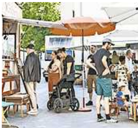
Resiliente Geschäftsmodelle – Führung zu Erfolgskonzepten.