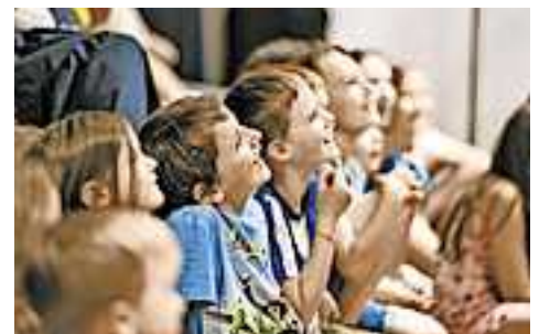
Vielfältiges Programm – auch für Familien.

Weitere Programm-Highlights und Informationen zum Kartenkauf finden sich auf www.emsiana.at