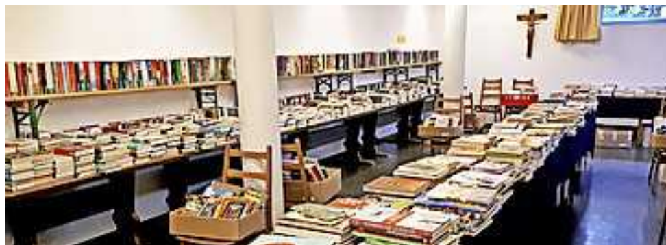
Weitere Infos unter www.hohenems.bvoe.at

Bücher und Zeitschriften für Groß und Klein zu Schnäppchenpreisen – hier ist für jeden etwas dabei! Seid dabei am Samstag, dem 6. Mai 2023, von 9 bis 13 Uhr.