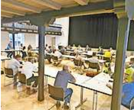
Die Stadtvertreter tagen erneut im Löwensaal.

Die Bürger haben zu Beginn der Sitzung wiederum die Möglichkeit, ihre Fragen und Anliegen an die Stadtvertreter zu richten.