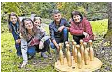
Spaß für klein und groß – Sagenwanderung zum Schlossberg.