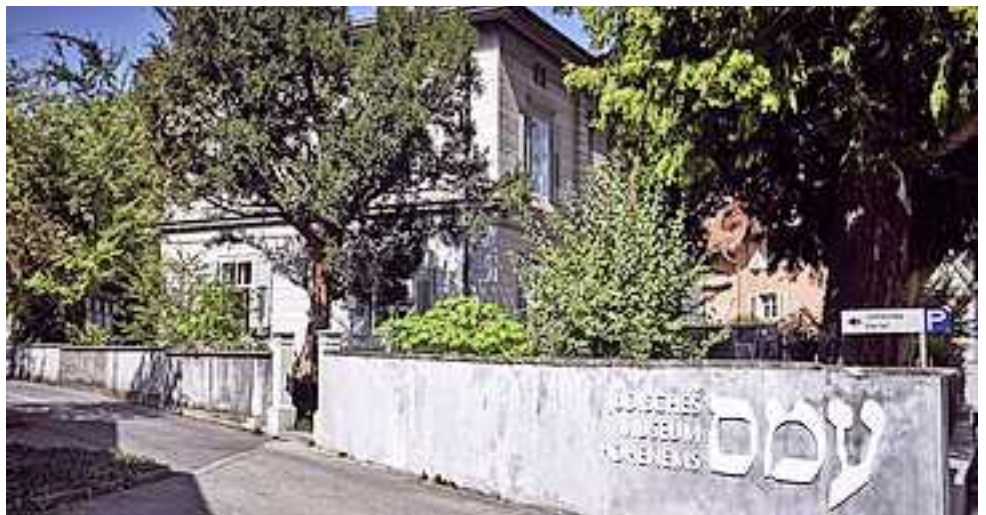
Jüdisches Museum Hohenems

Das Jüdische Museum Hohenems hat mit dem Radweg „Über die Grenze“ in den letzten Jahren bereits ein Format für die Vermittlung von Fluchtgeschichten realisiert, das international Beachtung findet und das der Kanton St. Gallen unterstützt. Ein zentraler Vermittlungsort im Raum Diepoldsau wird eine stärkere Breitenwirkung und weitere attraktive Formate ermöglichen. Zudem werden Besucher während ihres Aufenthalts in der Region die Möglichkeit haben, in Hohenems im bestehenden Museum und in den Bauten der ehemaligen jüdischen Gemeinde auch andere Aspekte der jüdischen Geschichte und Kultur zu erfahren.