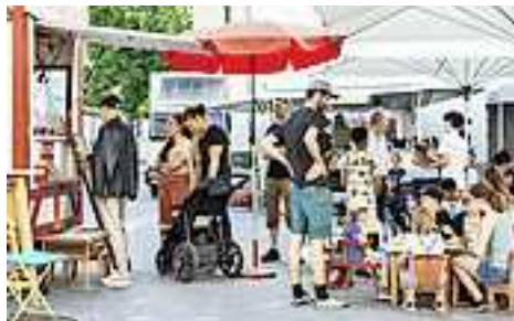
emsiana heißt auch Kultur im öffentlichen Raum.

Den Sonntagmorgen leitet das Quartett emsiana frei und kreativ mit einer Jazzmatinee ein. Am Sonntagnachmittag erwartet die Besucher dann mit der Eröffnung der neuen Ausstellung „A Place of Our Own – vier junge Palästinenserinnen in Tel Aviv“ des Jüdischen Museums ein weiteres Highlight.