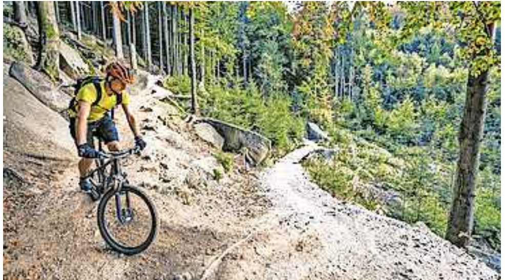
Gut und sicher vorbereitet in die Mountainbike-Saison

Auch dieses Jahr warten wieder viele spannende E-Mountainbike-Kurse auf Interessierte. Alle Termine und Details zur Anmeldung sind unter www.sicheresvorarlberg.at zu finden.