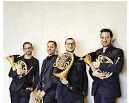
Das Rheingold Quartett als Solisten bei der diesjährigen Eröffnung (Foto: Rheingold Quartett).

Die teilnehmenden Museen sind im Zeitraum der emsiana kostenfrei oder ermäßigt zu besuchen. Die einzigartigen, kleinen Läden in und an der Marktstraße präsentieren ihre nachhaltigen und ökologisch wertvollen Ansätze als mutiges Zeichen junger, unabhängiger Kleinunternehmer- zu den Geheimnissen ihrer resilienten Geschäftsmodelle wird beim Kulturfest auch eine Führung angeboten.