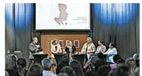
Angeregte Podiumsdiskussion im Kaschmir Club

Zum Round-up bot Collini allen Interessierten die Möglichkeit, gemeinsam das „Female Future Festival“ im Festspielhaus Bregenz zu besuchen: Der inspirierende Tag stand unter dem Motto „Neue Arbeitswelt“ sowie Netzwerkarbeit.