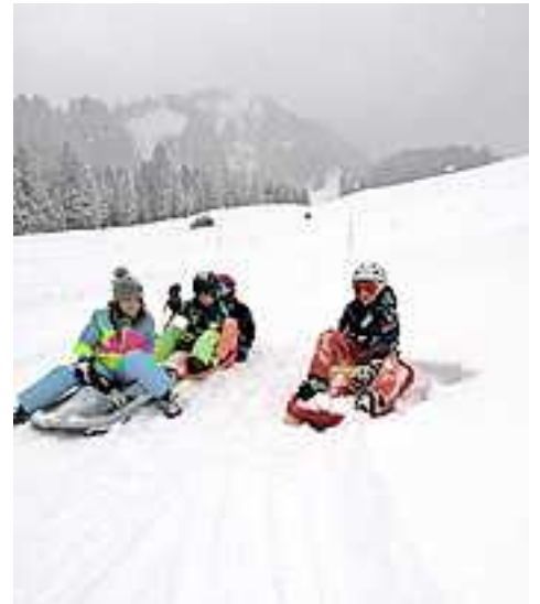
Rodelnachmittage zählen zu den Highlights der Schülergruppe.