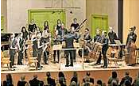
Das Puma Trio singt über Mutgeschichten (Foto: Dietmar Mathis).

Mit einem vielfältigen Programm lockt das Kulturfest emsiana vom 4. bis 7. Mai 2023 nach Hohenems. Ausgehend vom zentralen Genuss- und Sammelpunkt, dem Salomon-Sulzer-Platz im Jüdischen Viertel, spannt sich ein ganzes Netz an Veranstaltungen durch die Straßen der Stadt.