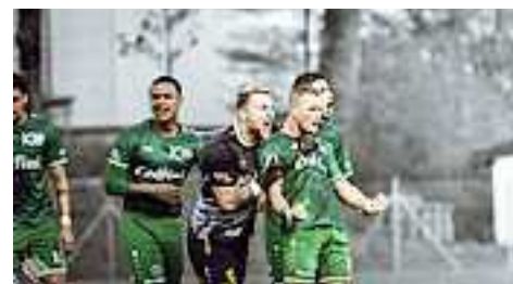
Hohenemser Jubel nach dem Sieg gegen die Pinzgauer.