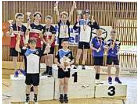
Erfolge für die jungen Hohenemser Radball-Schülerteams ...