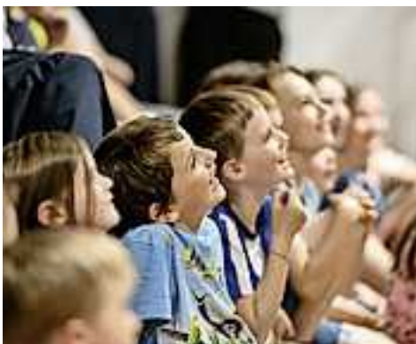
Vielfältiges Programm – auch für Familien.

Mal mutig, mal demütig, mal übermütig – mal laut und mal leise. Zum diesjährigen Thema „Über Mut“ exponieren sich zahlreiche Künstler. Unser aller Mut bedarf es, sich für als notwen-