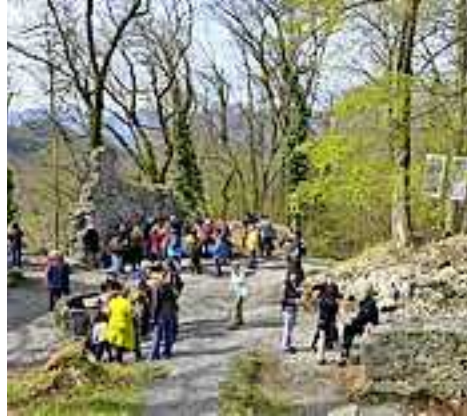
Zahlreiche Interessierte auf der Burgruine Alt-Ems.

Die frei zugängliche Installation auf der Burgruine Alt-Ems am Schlossberg ist nun bis 8. Oktober 2023 kostenlos zu sehen.