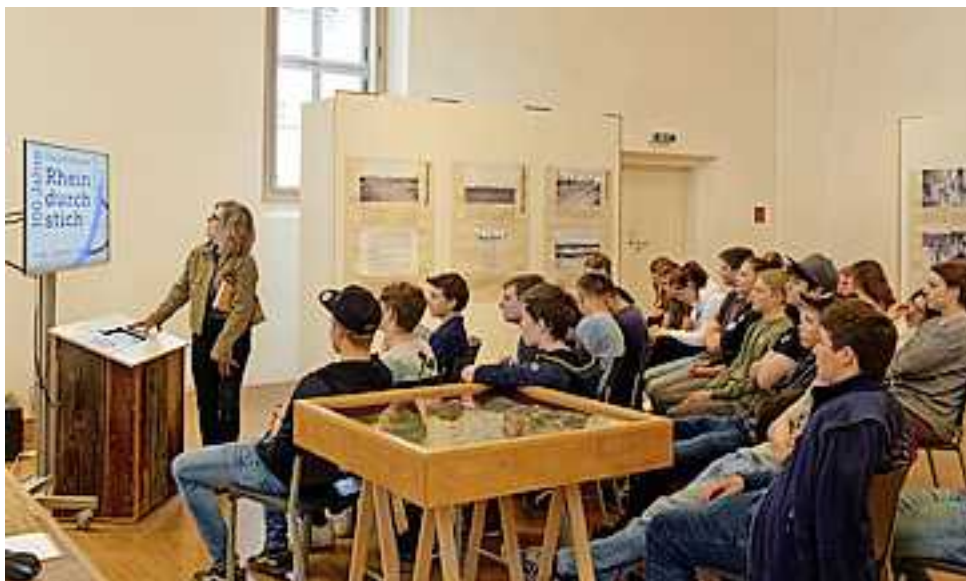
Rund 360 Schüler – hier aus dem Bäuerlichen Schul- und Bildungszentrum – besuchten während der Woche die Ausstellung.

Die Ausstellung verbleibt noch bis Sonntag, den 30. April 2023, in Hohenems. Anschließend wird sie in Widnau gezeigt, in einer der sieben beteiligten Gemeinden dieses Projekts.