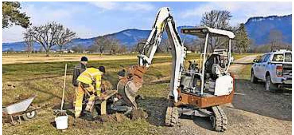
Die Werkhofmitarbeiter sorgen für kleine Ruheoasen.