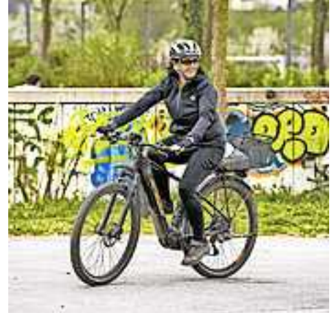
Weitere Informationen zum Angebot auf www.sicheresvorarlberg.at

„Sicheres Vorarlberg“ bietet zudem diverse E-Bike-Kurse und E-Mountainbike-Trainingsmöglichkeiten an, um die Fahrtechnik zu verbessern.