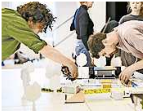
Poolbar Generator 2022 in Hohenems

„Wir freuen uns sehr, den Poolbar Generator heuer wieder in Hohenems begrüßen zu dürfen. Bereits letztes Jahr konnte ich beobachten, welche Dynamik bei den Studierenden in kürzester Zeit entsteht und wie Verbindungen zum Ort hergestellt werden.“