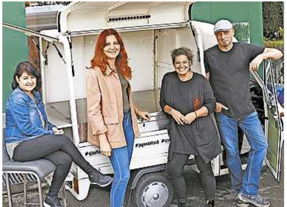
Das OJA-Team aus Altach wird sich vor Ort mit den Kollegen der anderen amKumma-Gemeinden abwechseln.

Am Stand der Offenen Jugendarbeit amKumma bekommen die Besucher einerseits die Möglichkeit, mit den Mitarbeitern vor Ort in den Austausch zu treten und sich über die Jugendarbeit in der Region zu informieren. Im gemeinsamen Dialog können die Arbeitsprinzipien, die Ausprägungsformen, die Methoden sowie Projekte, Angebote, Workshops und Events transparent gemacht werden. Andererseits können im Rahmen eines Gewinnradspiels „Seedbombs“ erspielt werden. Des Weiteren besteht die Möglichkeit, an der „aha Rally“ teilzunehmen. Interessierte Kinder und Jugendliche können außerdem eigene „Seedbombs“ herstellen. Die Samenbomben sollen dem schwindenden Nahrungsangebot für Bienen, Schmetterlinge und andere Insekten, die für