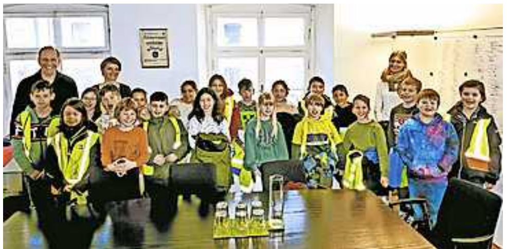
Die Schüler der 3a-Klasse im Bürgermeisterbüro.

Im Sitzungszimmer erfuhr die Klasse Wissenswertes über ihre Heimatstadt Hohenems, die verschiedensten Abteilungen und deren Aufgaben, und