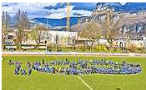
100 Jahre VfB – 100 Gründe zu feiern!

Besonders beeindruckend war am vergangenen Wochenende aber nicht nur der klare Sieg, sondern auch die Präsentation des VfB-Nachwuchses zur Halbzeit. 280 Kinder und Jugendliche samt Trainern marschierten auf und zeigten, wie viele Jungsteinböcke es mittlerweile gibt. Ein stolzer Nachwuchsleiter Simon Reis holte jedes Team einzeln aufs Feld.