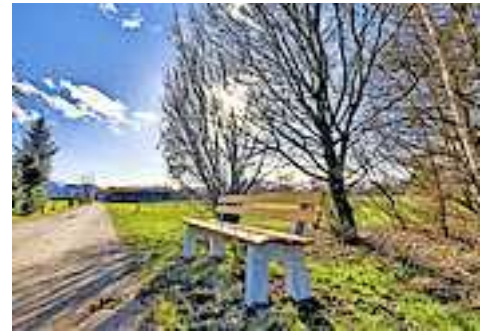
Auch entlang der Sohlstraße kann man nun entspannen.

Das städtische Werkhofteam hat damit täglich alle Hände voll zu tun, sind doch im gesamten Stadtgebiet insgesamt 239 Ruhebänke, 205 Abfalleimer, 19 Abfalleimer, die den Abfall auch gleich verdichten sowie 74 Robidogs samt Hundesackspendern zu betreuen.