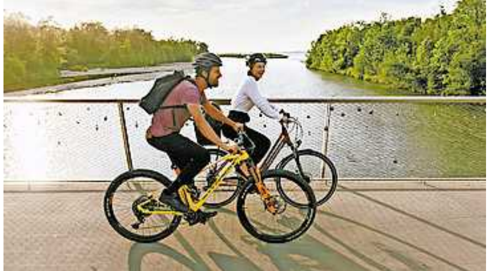
Radius 2023: Mitradeln und tolle Preise gewinnen.