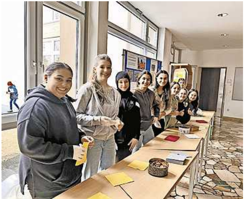
Die fleißigen Bäckerinnen.

Ein großer Dank gilt den beteiligten Mädchen und auch deren Eltern, welche dieses Projekt durch ihre großartige Unterstützung mitemöglicht haben.