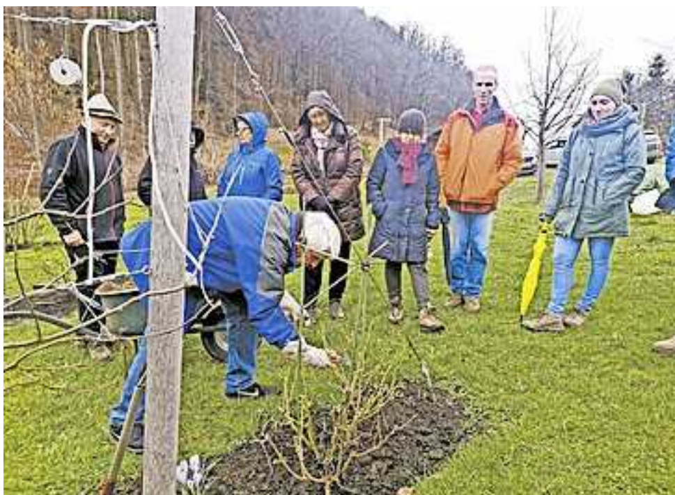
Weitere Infos zum OGV Emsreute unter www.ogv.at/ogv-emsreute

Im Juli findet der zweite Teil des Kurses statt: „Rosenschnitt nach der Blüte“.