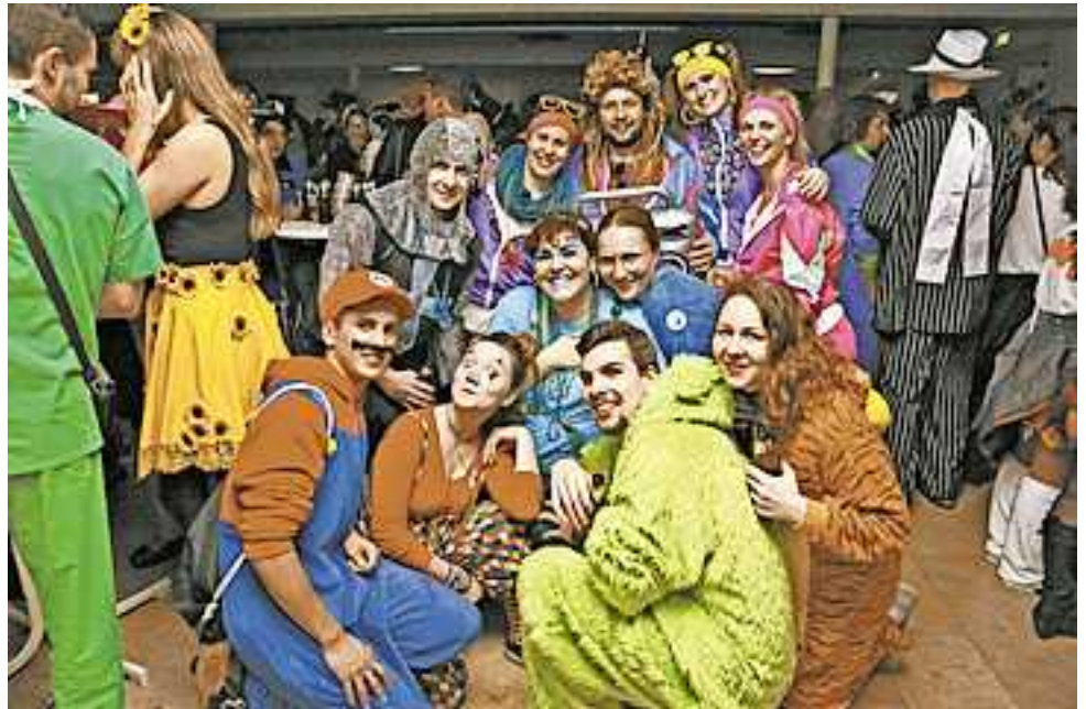
Alle weiteren Infos unter www.hohenems.travel.

Die Sportfliegergruppe Hohenems veranstaltet ab 20 Uhr eine Fliegerparty. Ein DJ wird auflegen und bis in die frühen Morgenstunden für gute Stimmung sorgen.