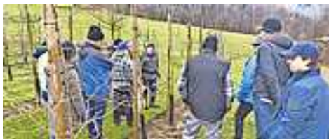
82 Teilnehmer zeigten sich begeistert vom Baumschnittkurs.

Der Kurs war mit 82 Teilnehmern ausgesprochen gut besucht und es gab ausschließlich positive Rückmeldungen. Das Kursangebot wird somit weitergeführt.