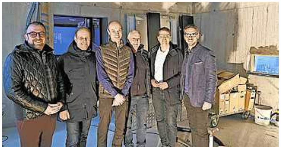
Auch die Vertreter der Stadt machten sich vor Ort ein Bild.

Entstehen wird ein Neubau mit drei Stockwerken. Im Erdgeschoß wird ein Gastraum für 40 Personen und eine Theke gestaltet. Im ersten Obergeschoß werden die WC-Anlagen, die Küche, Lager und Kühlräume eingerichtet. Und im zweiten Obergeschoß entstehen ein Besprechungsraum, ein Lagerraum und die WC-Anlagen für die Arbeitnehmer. An der Süd- und an der Westseite gibt es zudem einen Gastgarten für insgesamt 40 Personen.