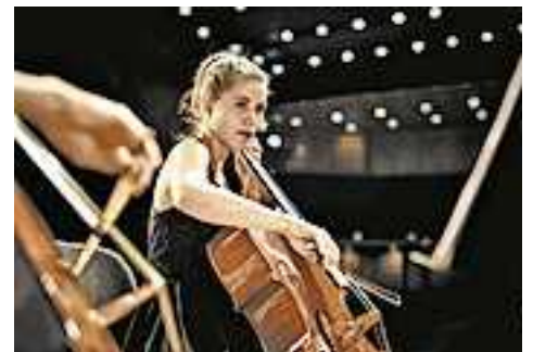
Weitere Infos unter www.quarta4.org

Tickets erhalten Sie unter E-Mail vorverkauf@quarta4.org oder Tel. 0650/8272181; Restkarten an der Abendkasse.