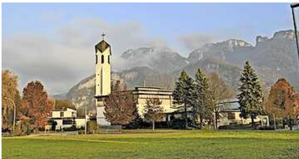
Pfarre St. Konrad

Eine Lesung von Texten des bekannten Emser Dichters Alfred Willam wird ebenso geboten wie Zauberkunst und natürlich viel Musik. Eine Show, bei der es auch Raum für Begegnungen geben soll, kündigt sich an.