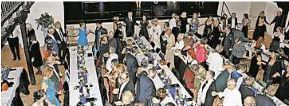
Sirtaki im Löwensaal.

Erheiterung und Spaß pur waren abschließend angesagt, denn der gesamte Saal tanzte unter Anleitung und Mithilfe der Damen der „Dance Art Company“ mit mehr oder weniger gutem Erfolg den Sirtaki. Die Tombola brachte über 200 zum Teil großartige Preise (jedes Los gewann) unter die Gewinner. Erst am frühen Sonntagmorgen verabschiedeten sich die letzten Gäste am Ende eines flotten, wieder feinen und gemütlichen Sängerballes.