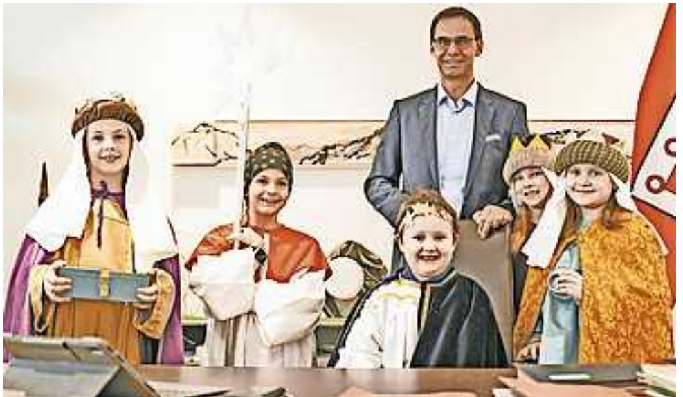
Hohenemser Sternsinger zu Besuch bei Landeshauptmann Markus Wallner

Seit Beginn der Aktion im Jahr 1954 haben die Sternsinger österreichweit 520 Millionen Euro für Menschen in den Armutsregionen der Welt gesammelt. „Die Kinder und Jugendlichen setzen durch ihre Teilnahme an der Sternsingeraktion ein starkes Zeichen von Verantwortung und Solidarität“, lobte der Landeshauptmann.