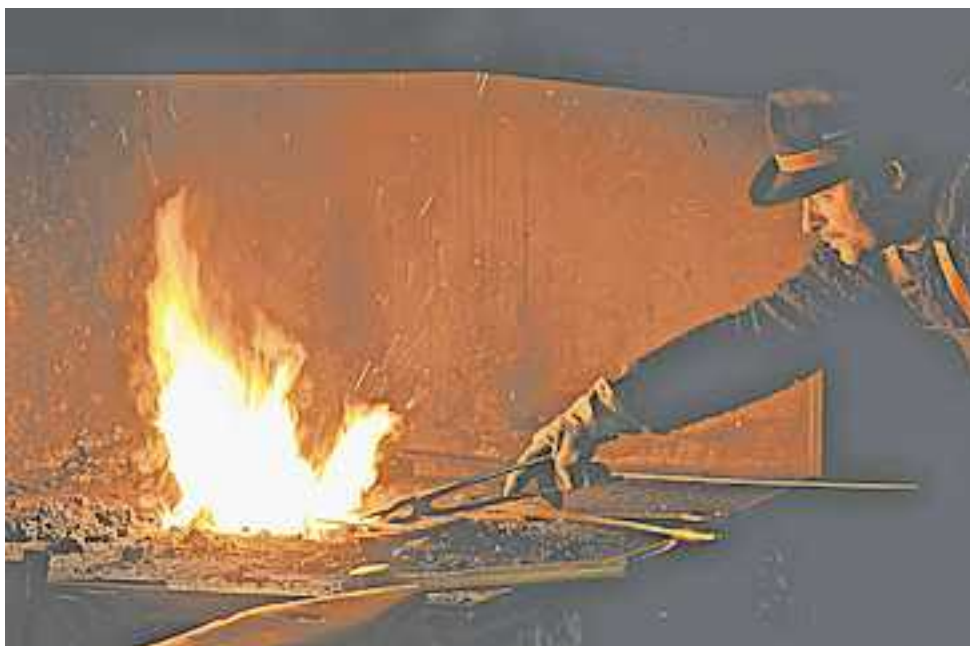
Alle Infos und aktuelle Öffnungszeiten finden sich auf www.steel-soul.com

Um die Faszination des Schmiedehandwerks hautnah zu erleben, bietet „Steelsoul“ auch regelmäßig Führungen und Kurse rund um das Thema Schmieden, Handwerk und Outdoor an.