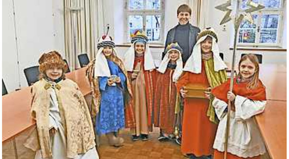
Sternsinger zu Besuch im Rathaus