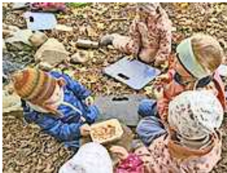
Teilen war das Motto in der Waldspielgruppe

Anmeldungen sind unter Tel. 05576 42601 oder auf www.ringareia.at möglich.